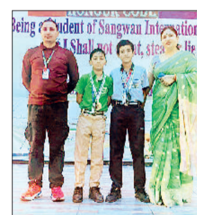
रोहतक। प्रतियोगिता में उत्कृष्ट प्रदर्शन करने वाले छात्रों के साथ शिक्षक।