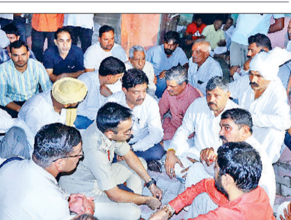
रोहतक। मौके पर जमा पुलिस व ग्रामीण।